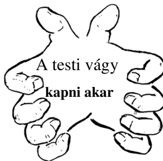
A testi vágy önző

A szerelem önzetlen , – adni akar. A szerelem azt akarja, ami a legjobb a másik személynél. A szerelem tud