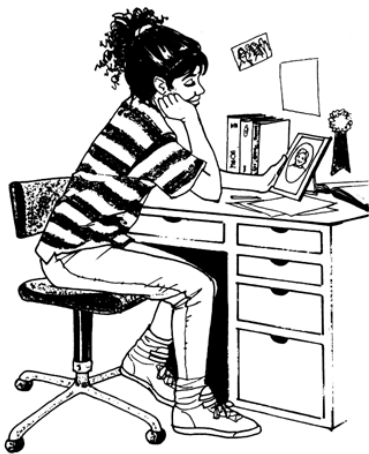
A fellángolás NEM igazi szerelem

annyira elveszted az ítélőképességed, hogy nem tudod, mit teszel.